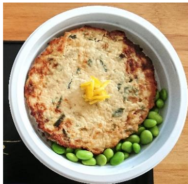
Tofu - Yuzu (végétarien) 10,00 €