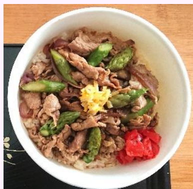
Porc - Yuzu porc Label Rouge du marché