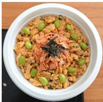
Saumon - Miso riz vinaigré / nature 10,00 €