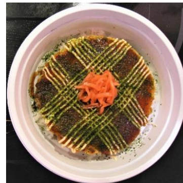
Tofu - Okonomiyaki (végétarien) 10,00 €