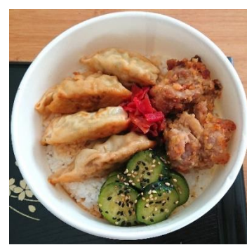
Gyoza + Kara agé poulet fermier du marché 10,50 €