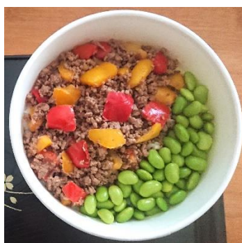
Bœuf - Miso bœuf charolais du marché 10,50 €