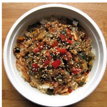
Konjac - Kinpira (végétalien) 10,00 €